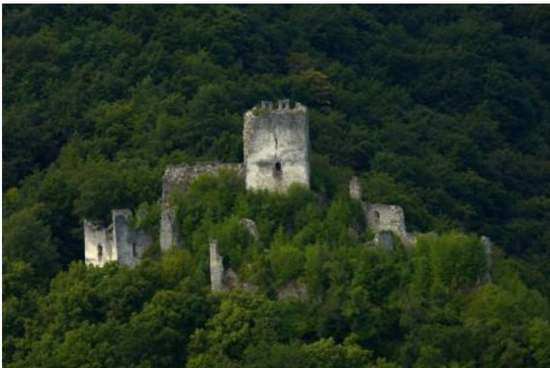
Razvaline gradu v Kunšperku

Južni stolp danes še stoji, v njegovi notranjosti pa je globoka klet. Legenda pravi, da so se fantje stavili, kdo bo šel noter. Izžrebani je dobil klobčič volne, ki ga je drugi držal v roki, sam pa je šel v notranjost stolpa in hodil tako dolgo, da mu volne ni zmanjkalo. Čez dve uri se je vrnil čisto zmešan. V resnici ni prišel do cilja, saj se je v krogu spuščal po stopnicah navzdol. Legenda pravi, da so v kleti veliki sodi, polni zlata in drugega bogastva. Ampak nihče ne more do njega, saj ga čuvajo velike kače.