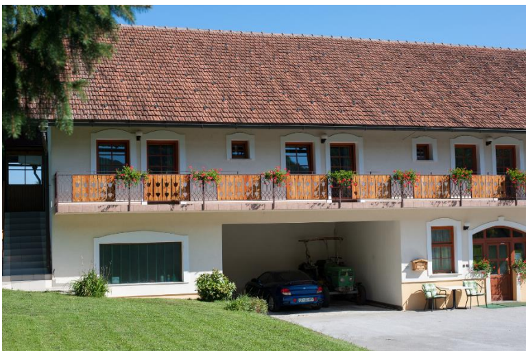
Turistična kmetija Kramer

Turistična kmetija Kramer ponuja prijetno in sproščeno druženje v naravnem okolju in okusno hrano, pripravljeno po starih domačih receptih. Turistična kmetija ima odprto teraso in veliko zelenih površin za piknik z žarom. Na voljo so tudi različne aktivnosti, kot npr. igre z žogo, balinanje, športno streljanje, možna je izposoja koles in različnih igral [6].