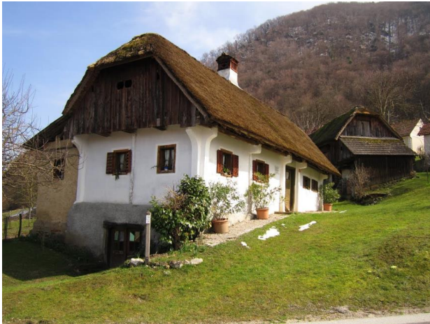
Kravaričeva domačija

Kravaričevo domačijo sestavljajo lesena, s slamo krita hiša, ki je stara več kot 200 let. Hiša ima obnovljena in ima ohranjeno črno kuhinjo, skedenj, ki je prav tako pokrit s slamo, ter lesen svinjak s straniščem. V hiši gre za klasično razporeditev: skozi vrata vstopimo v kvadratno vežo in od tam v vse tri preostale prostore: v črno kuhinjo pred nami, v desno »hišo«, ki je služila kot spalnica, ter v levo »hišo«, ki je služila kot kuhinja in dnevni bivalni prostor. Notranjost hiše z eksponati je dobro ohranjena [5].