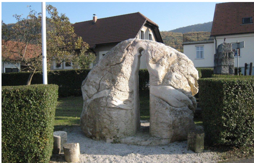
Antipranger v Bistrici ob Sotli

Kot trg je Kunšperk imel tudi pranger ali sramotilni kamen, ki je na skrivnosten način prišel v Podsredo. Leta 1882 naj bi jim ga Šepetrani ukradli, zgodba pa naj bi pravila, da so se ponoči pripeljali ponj na vozovih, ki so imeli kolesa obvezana z rutami, da se jih ne bi slišalo. Podvig jim je uspel, a so ga morali kmalu vrniti nazaj. Po prvi svetovni vojni so se šempeterski fantje zopet odločili, da ga vzamejo nasprotnikom. Neki ponočnjaki so ga podrli, pri čemer je kamnu odletela glava. Srejani so ga nato prevezali z železjem in prikovali na steno. Ker ga niso mogli odpeljati s seboj, so si Šepetrani naredili vzorec tega PRANGERJA, ki se imenuje ANTIPRANGER. Še danes stoji nasproti občinske hiše in je namenjen občanom, ki si zaslužijo posebno čast. Pranger je še danes vzrok za rivalstvo med Šepetrani in Srejani, kakor da bi bilo od njega odvisno trško dostojanstvo [2].