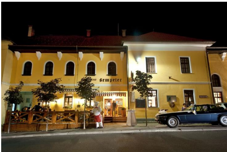
Gostišče Šempeter v Bistrici ob Sotli

Gostišče Šempeter s svojo ponudbo pomaga širiti prepoznavnost slovenske kulinarike. V znak kvalitete in gostoljubja ima pravico do uporabe blagovne znamke Gostilna Slovenije. Pri sestavi ponudbe kuharji upoštevajo sezonske jedi. Najbolj znana jed je kopun, tj. skopljen petelin. Kopune redijo zgolj zaradi cenjenega belega mesa. Kopun je večji od piščanca. Maščoba se mu ne nabira le v enem delu telesa kakor kokoši, ampak je porazdeljena med mesnim tkivom [9].