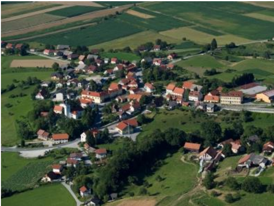
Bistrica ob Sotli

Bistrica ob Sotli je slikovito naselje v skritem koticu južne Štajerske, na vzhodnem obrobju Slovenije. Na severu meji na občino Podčetrtek, južno na občino Brežice, zahodno na občino Kozje. Od bizeljskih vinskih goric jo loči predalpski greben gozdnate Orlice. Ime ji daje reka Bistrica, ki se skozi eno najlepših sotesk v Sloveniji tukaj poslavlja od nekdanjih žitnih mlinov in se pridruži vijugasti in počasnejši Sotli. V središču Bistrice ob Sotli ob križišču treh cest, kjer se trške hiše ponašajo s klesanimi kamnitimi portali, se razgleduje po okolici župnijska cerkev sv. Petra s freskami iz 15. stoletja, prvič omenjena že leta 1275. Ob cestah in poteh, ki so romarje nekoč vodile k Svetim goram, nas na preteklost opominjajo številna kamnita znamenja. Bistrica ob Sotli, ki je v preteklosti zamenjala kar nekaj imen, od prvotnega Leskovca, Svetega Petra pod Svetimi gorami do Bistrice ob Sotli, je od leta 1999 sedež samostojne občine, ki ji pripadajo naslednje vasi: Dekmanca, Črešnjevce, Hrastje, Križan Vrh, Kunšperk, Ples, Polje, Srebrnik, Trebče in Zagaj [1].